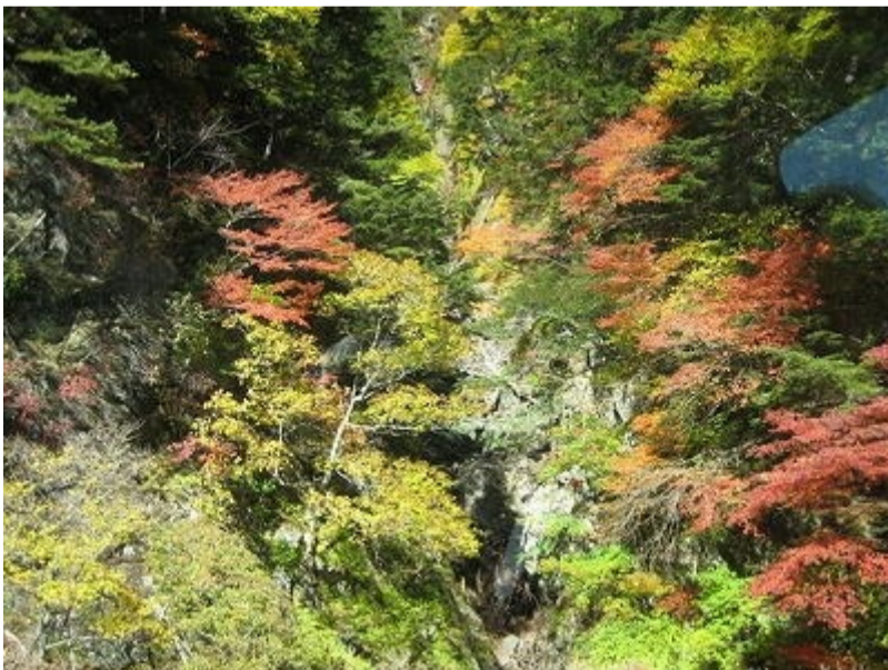
5 白鳳溪谷あたりの紅葉