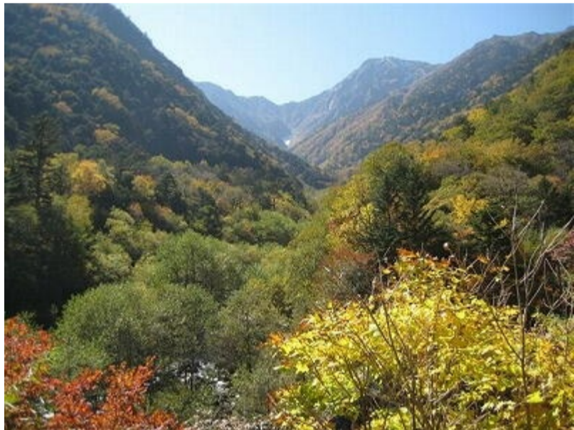
4 白鳳溪谷あたりの紅葉