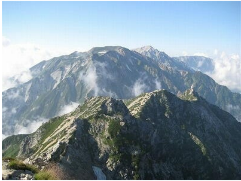
2 唐松岳から白馬三山を望む