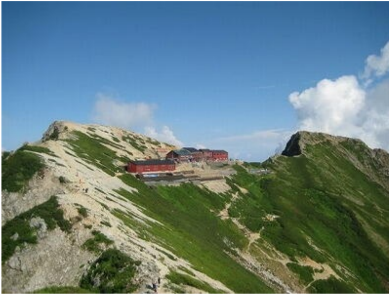
1 唐松岳山頂(2696m)から山小屋を眺める

唐松岳頂上山荘の知人から「山は待ってくれるけど、歳は待ってくれないよ」とメールがあった。ガイドブックでは4時間半のところを、7時間かかって山荘に辿り着いた。元気な中高年の女性が多く、山荘は小綺麗で、かつての山小屋のイメージとは様変わり。新婚まもなく、ちょっと山に行くと言って出かけたのが北岳である。この山が富士山に次ぐ日本で二番目に高い山だと、帰宅後家内が知ることになる。それ以来、山行きは警戒されている。10月末南アルプス林道横断のバスツアーに参加し、懐かしの北岳や鳳凰三山など南アルプスの山々を見て感激する。かつて南アルプスは目的の山に行くまでが大変だったが、今や高速道路やバイパスなど道路が良くなったのには驚き。