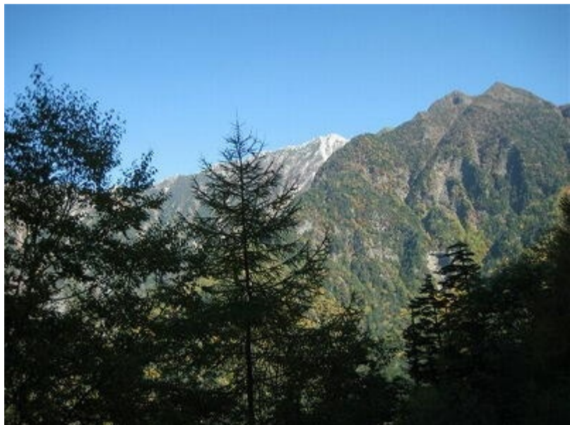
6 鳳凰三山などを眺めながら